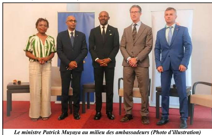
Le ministre Patrick Muyaya au milieu des ambassadeurs (Photo d'illustration)

À l'issue de la formation, des certificats ont été remis aux participants. Prenant la parole au nom des apprenants, leur délégué a exprimé le souhait que cette initiative ne soit pas la dernière, appelant à la pérennisation des formations en vérification de l'information.