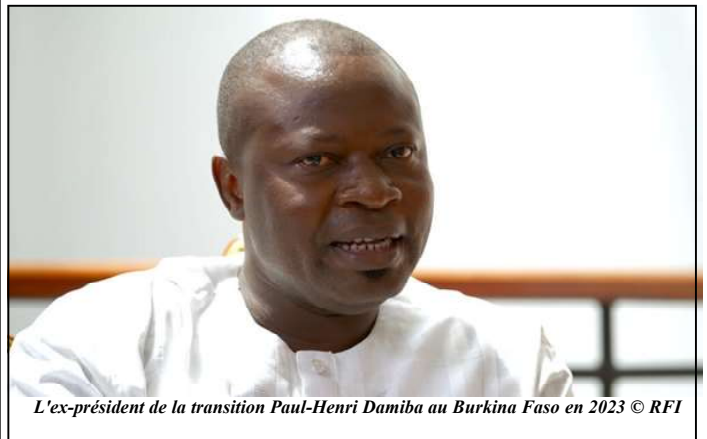
L'ex-président de la transition Paul-Henri Damiba au Burkina Faso en 2023