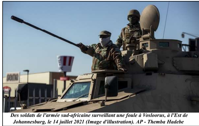
Des soldats de l'armée sud-africaine surveillant une foule à Vosloorus, à l'Est de Johannesburg, le 14 juillet 2021 (Image d'illustration).

ils voient quelqu'un faire quelque chose de mal, ils le considèrent