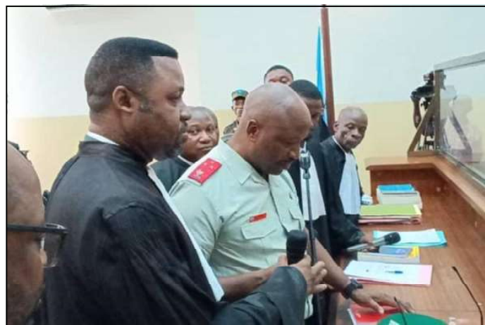
Le lieutenant-général Philémon Yav à l'audience devant la Haute cour militaire.

l'avoir " jamais vu " et affirme qu'il aurait été effacé par le prévenu durant l'enquête. Les données du téléphone