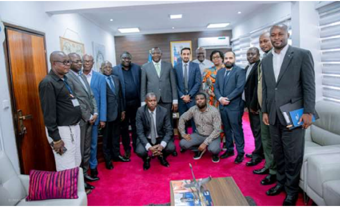
Mutumbo, a présidé, le mardi 27

plateforme repose sur deux composantes majeures. La première concerne l'architecture globale du système, conçue pour assurer une intégration complète et sécurisée des don-