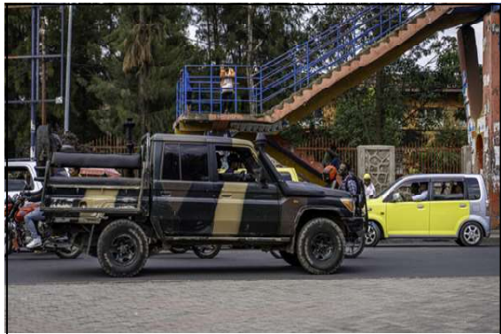
An M23 pickup truck drives through Goma, capital of North Kivu province in eastern DRC, on 15 January 2026, nearly a year after the rebels took control of the city.

One year after the attack by the AFC-M23 group and its Rwandan allies, no one can say for certain how many people were killed.