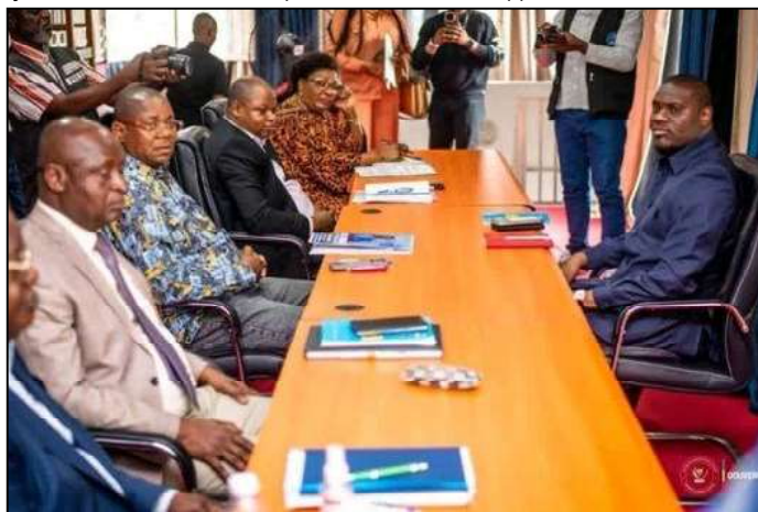
Le Gouverneur du Kongo Central, Grâce Bilolo reçu par le Bureau de l'Assemblée provinciale, le mardi 27 janvier 2026.

million de dollars américains, a été reçu par le Bureau pour des échanges avant la prise de cette décision.