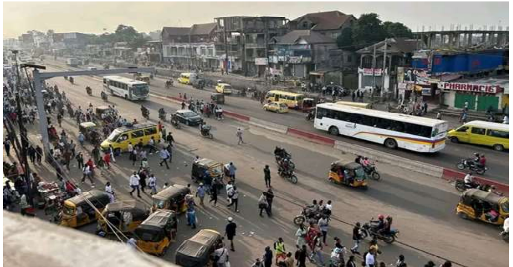
Transport urbain cadavérique à Kinshasa, faute de véhicules en nombre suffisant, la population fait la ligne 11 (Lire en page 16)