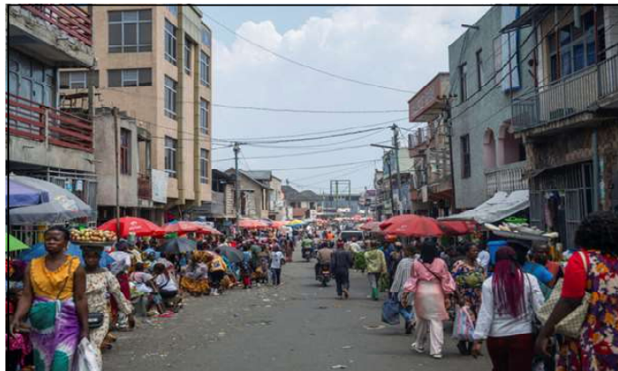
People mingle at a market in Goma as residents and businesses struggle to access cash and conduct basic transactions following clashes between M23 rebels and the Congolese army.

In April, the M23 tried to relaunch the local branch of the Caisse générale du Congo (CADECO). The initiative has had little success - Kinshasa