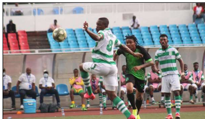
Un moment du match AS Vclub - DCMP du 22 novembre 2020 au stade des Martyrs à Kinshasa (1-0).

Salvador FC de la division Lipopo recevra Bana Dora de l'EPFKIN, et AC Rangers sera opposé à RC Golf de l'Entente Kilimani.