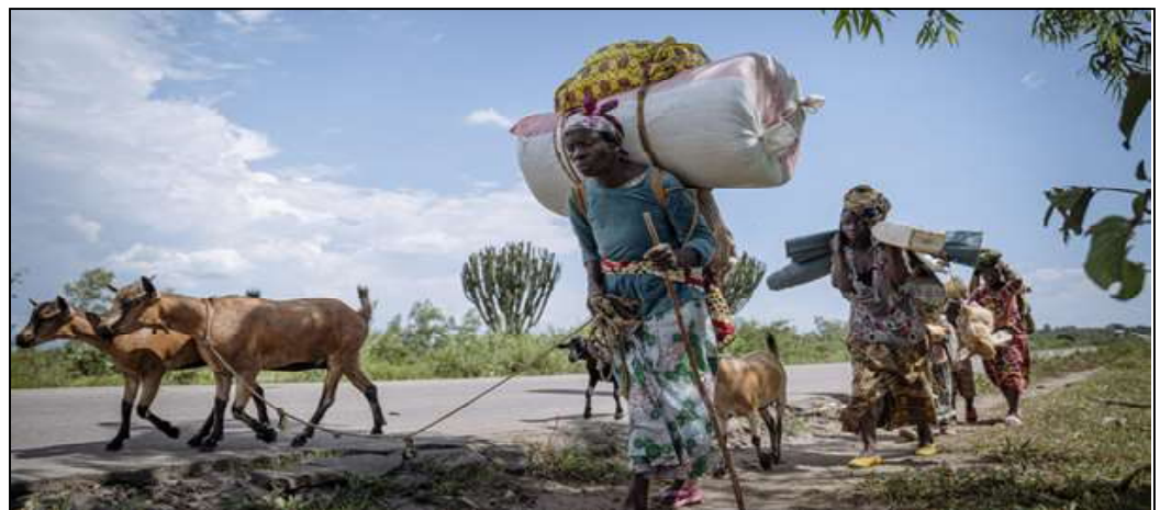
Une famille déplacée de Sange, accompagnée de ses enfants et de son bétail, retourne vers le village de Togota après avoir cherché refuge ailleurs à la suite d'une accalmie dans les combats, à Abwegera, dans le Sud-Kivu, à l'est de la République démocratique du Congo, le 13 décembre 2025.

Qui plus est, l'aide humanitaire ne peut pas être la seule réponse. Plusieurs leviers existent pour réduire les besoins : solutions politiques, prise en compte des causes des conflits,