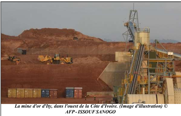
La mine d'or d'Ity, dans l'ouest de la Côte d'Ivoire. (Image d'illustration)

Pour les autorités canadiennes, qui ont durci le contrôle des investissements étrangers dans les ressources naturelles, le dossier sera scruté de